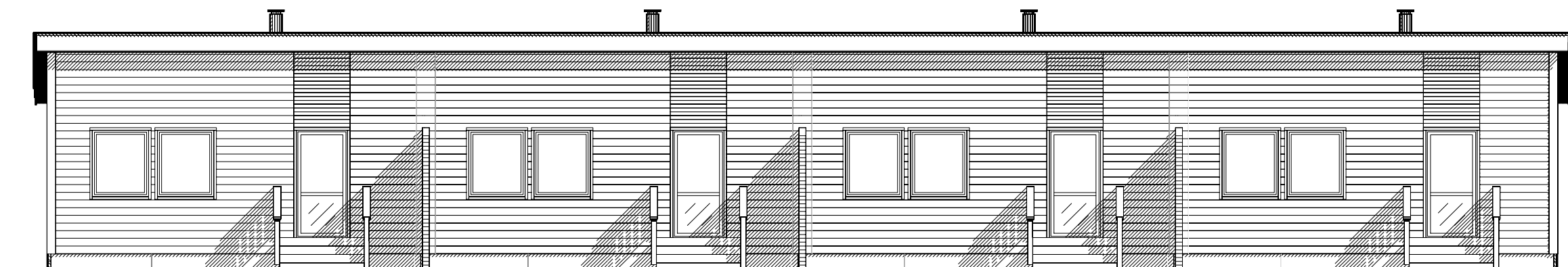
FASADE MOT SØR